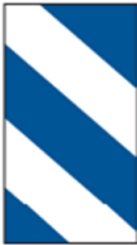
Figur 7.1-a Exempel på baksidesreflex till vägmärke.