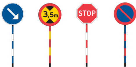
Figur 7.1-c Exempel på färger på reflexrör.

Färgen på reflexröret ska följa vägmärkets grundfärger och reflexklasser. Om det finns ett annat märke på baksidan följer reflexröret dessa grundfärger på baksidan. Det innebär att det kan finnas flera olika färger på reflexröret på samma stolpe.